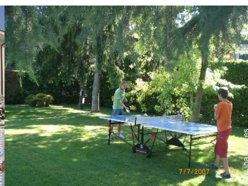
mesa de ping-pong