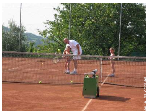
Tenis - tierra batida