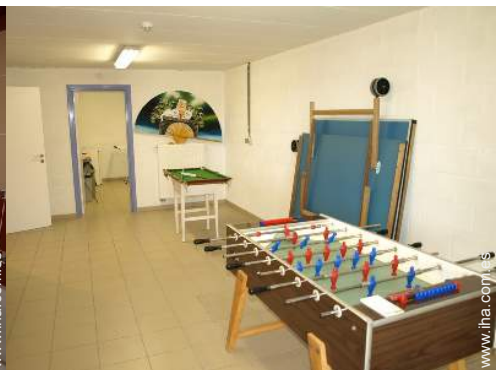
sala de juegos