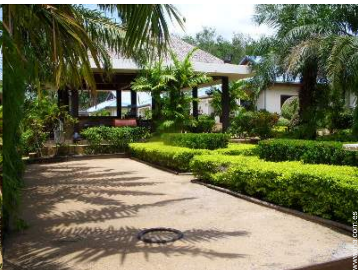
terreno de petanca