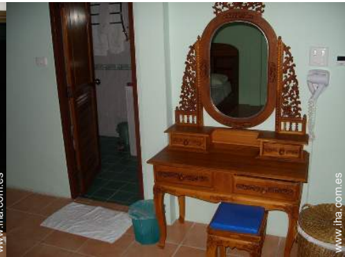
secador de pelo