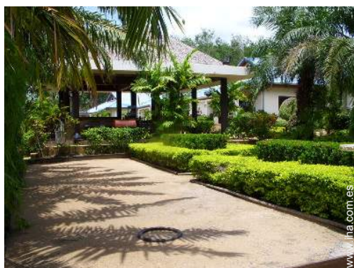
terreno de petanca