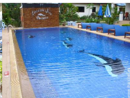
Piscina a desbordamiento