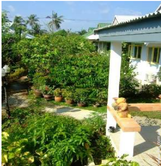
vista sobre el patio