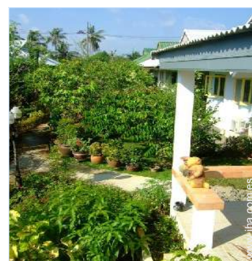
vista sobre el patio