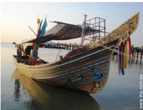
excursión en barco