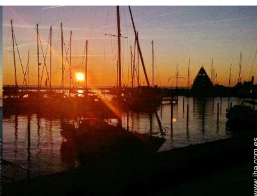
vista sobre el puerto