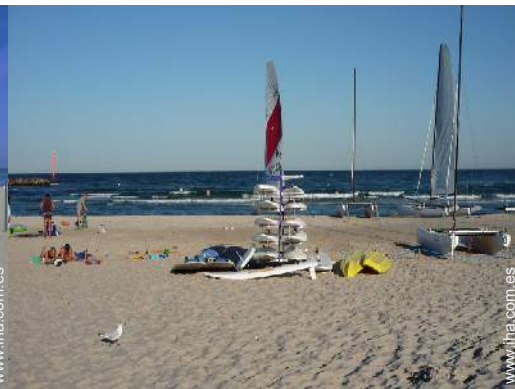
actividades náuticas cercanas