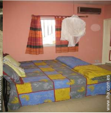
habitación del propietario