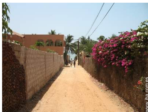
Zonas atractivas y relajación