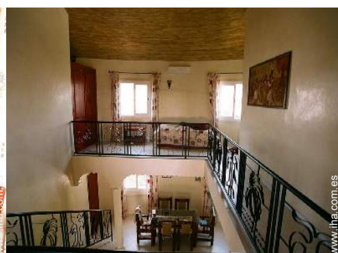
vista desde le entresuelo