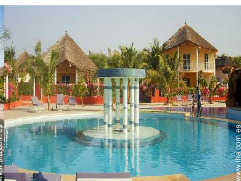
Propiedad de Lujo