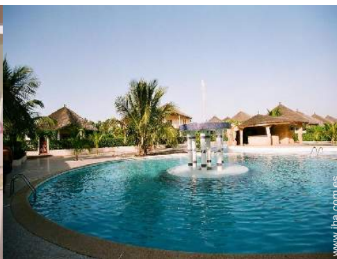
Piscina a desbordamiento