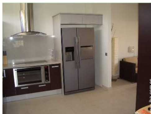
máquina de hielo