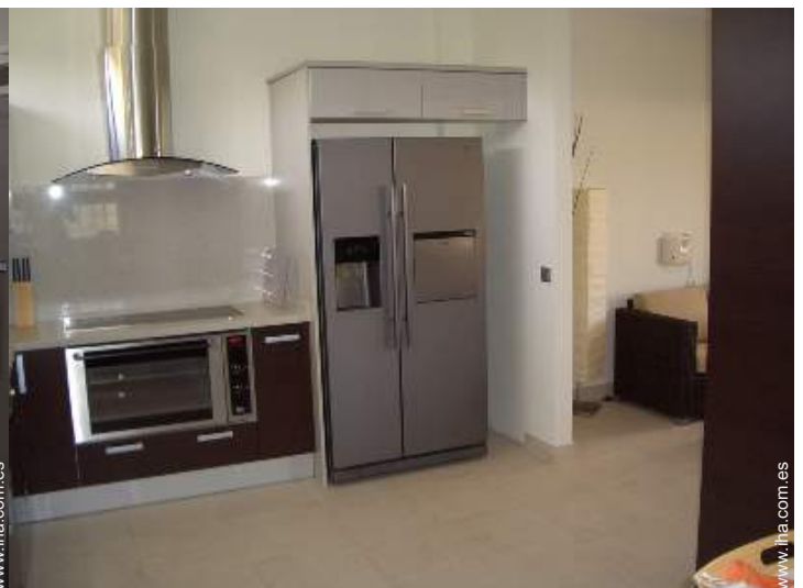
máquina de hielo