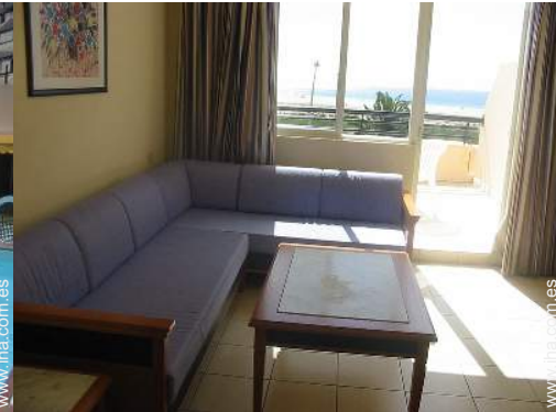
área de descanso