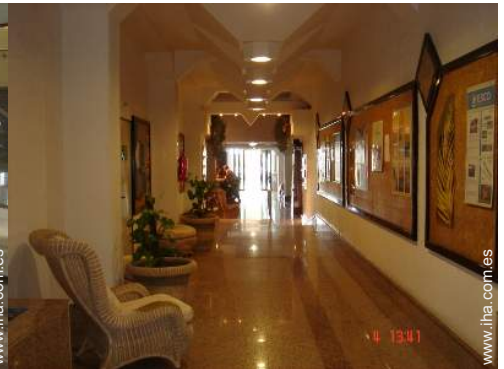
Confort interior e instalaciones