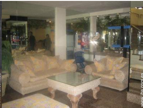
Zonas atractivas y relajación