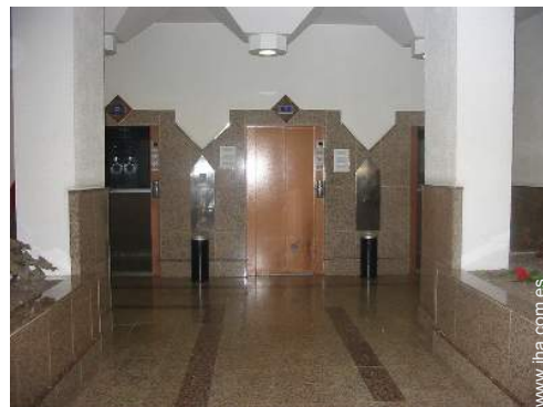
Confort interior e instalaciones