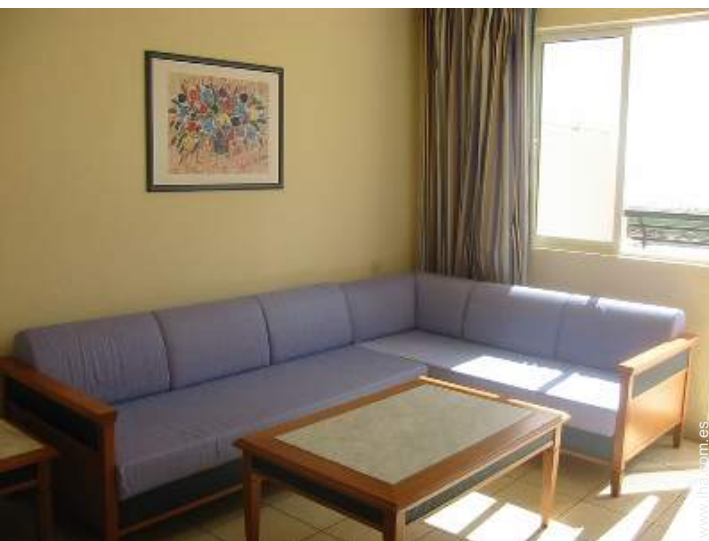
área de descanso