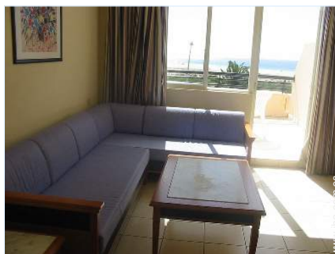
área de descanso

Acondicionado para disminuidos : movilidad