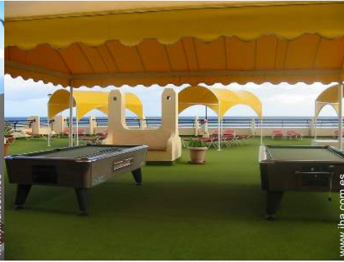
mesa de billar