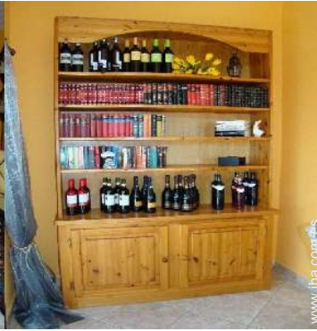
colección de libros