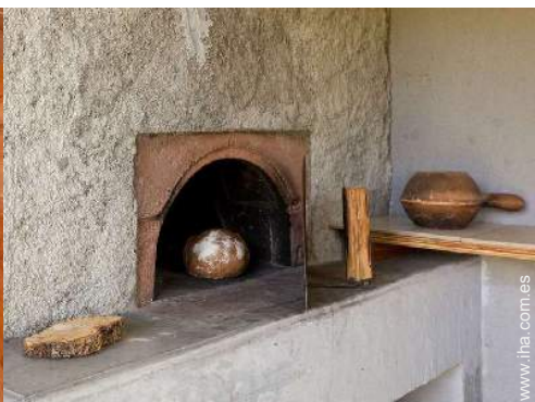
horno de pizza