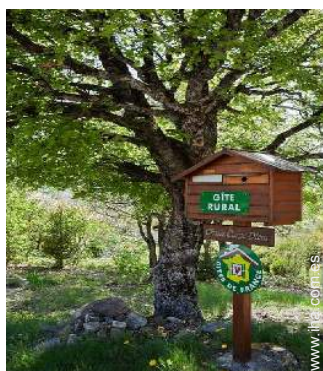
Chalet de Montaña con Encanto