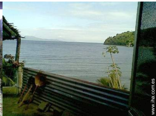
vista desde la terracea