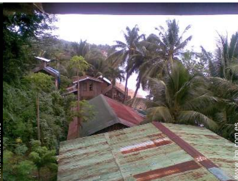
vista sobre el pueblo