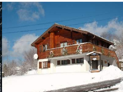
Chalet de Montaña