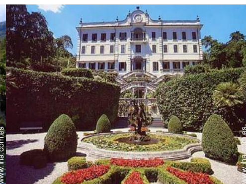
Zonas atractivas y relajación