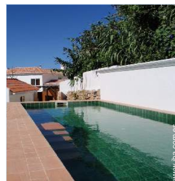
Instalaciones exteriores a disposición de los huéspedes