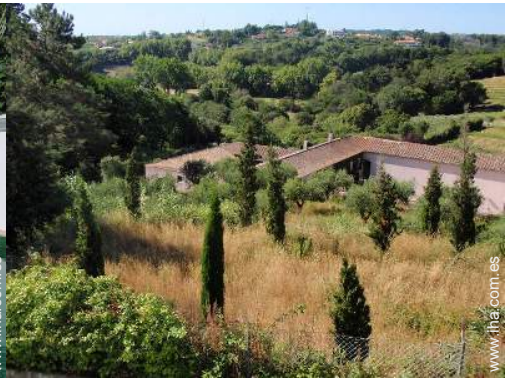
Instalaciones exteriores a disposición de los huéspedes