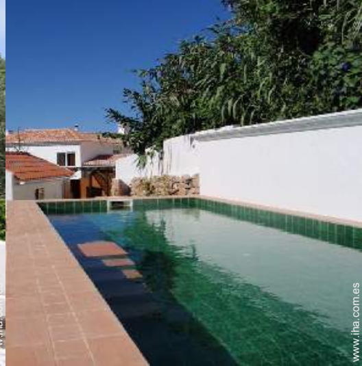
Instalaciones exteriores a disposición de los huéspedes