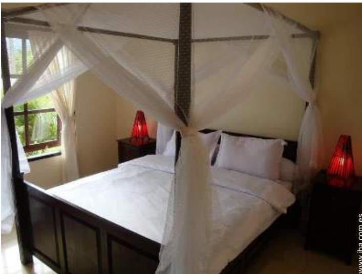
cama(s) de matrimonio(s) con baldaquín