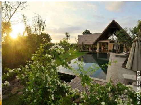
vista sobre la apuesta del sol