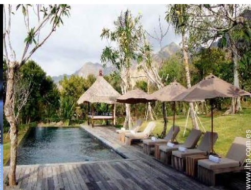
Piscina a desbordamiento