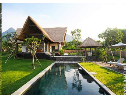
Chalet de Lujo