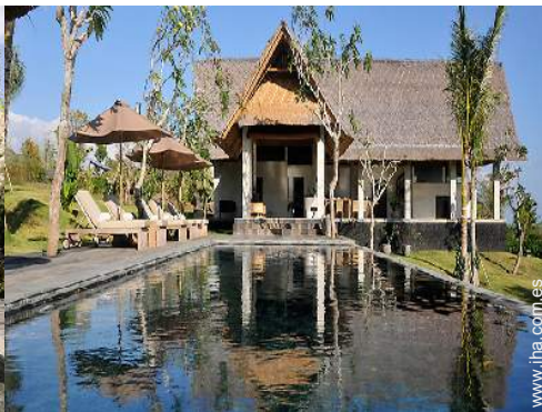
Chalet de Lujo