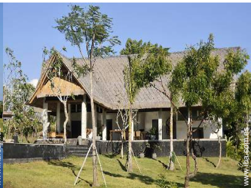
Chalet de Lujo