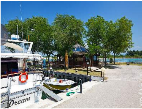
plaza de barco en el puerto