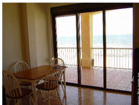
vista desde le comedor

Animales aceptados bajo condiciones (informarse con el propietario)