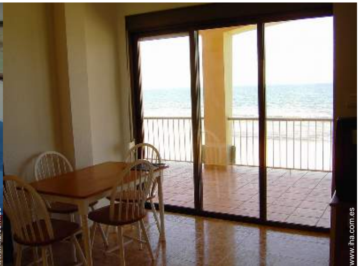
vista desde le comedor