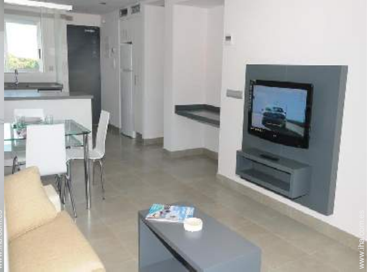
Confort interior e instalaciones