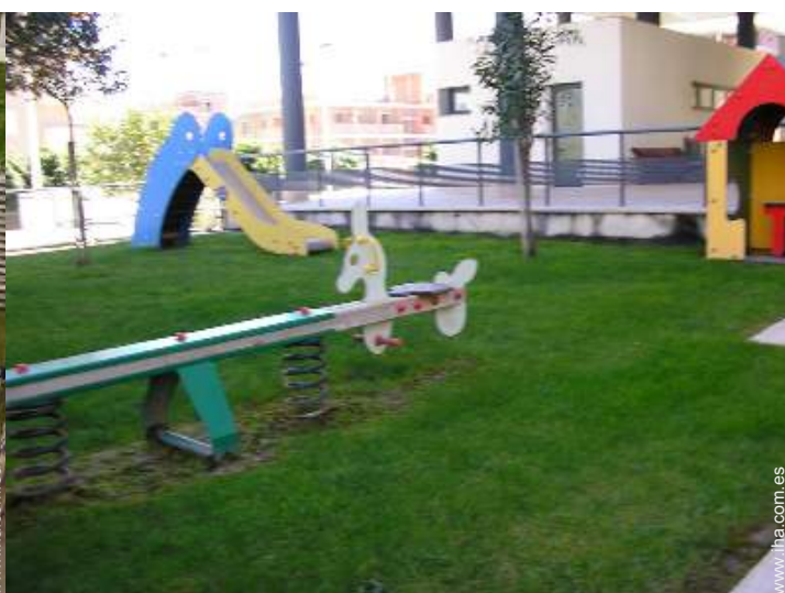
Instalaciones exteriores a disposición de los huéspedes