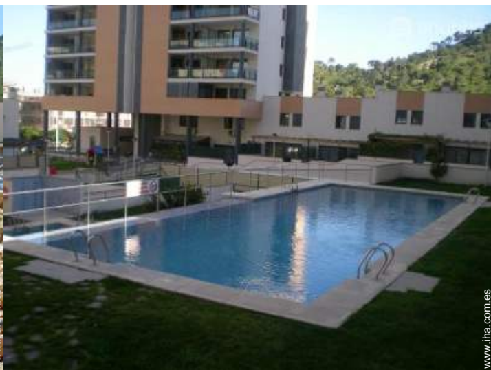
Instalación exterior a disposición de los huéspedes