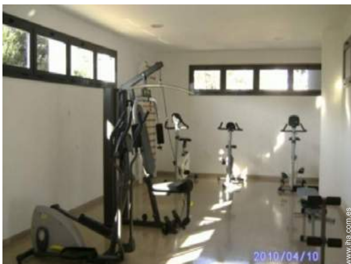
Instalaciones exteriores a disposición de los huéspedes