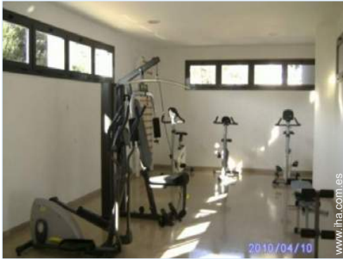
Instalaciones exteriores a disposición de los huéspedes