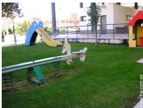
Instalaciones exteriores a disposición de los huéspedes