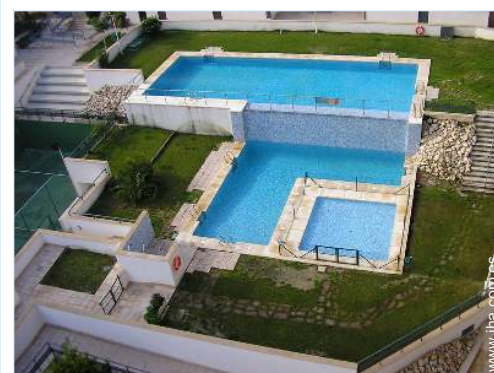
Instalación exterior a disposición de los huéspedes

- Parada/estación de autobús 100m - Panadería 100m - Pequeños comercios 100m - Supermercado 100m - Banco 100m - Farmacia 200m