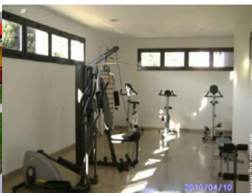
Instalaciones exteriores a disposición de los huéspedes