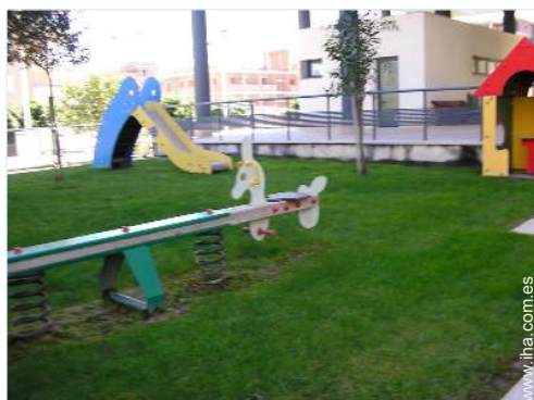
Instalaciones exteriores a disposición de los huéspedes