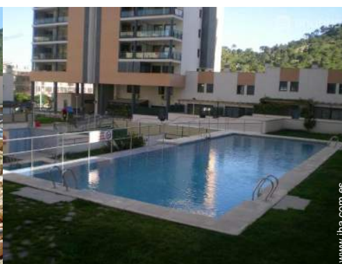
Instalación exterior a disposición de los huéspedes