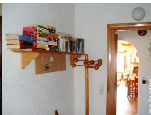
coleccion de libros