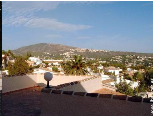
vista desde la azotea