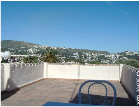
vista sobre las azoteas