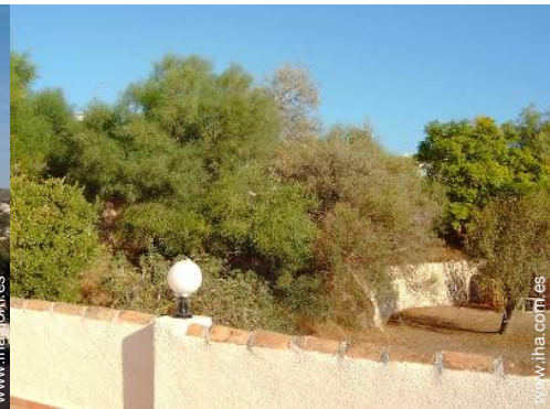
vista desde la azotea