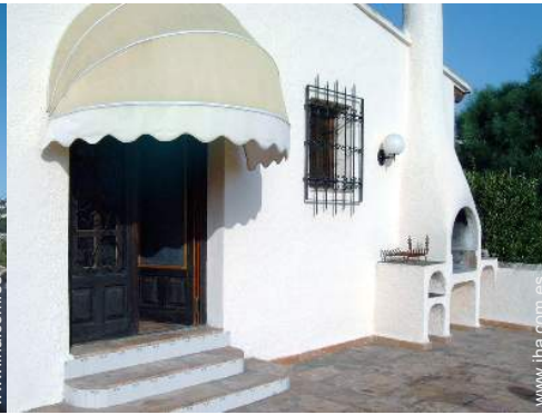
vista desde la azotea