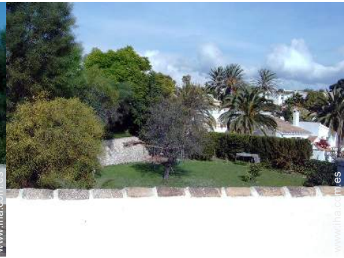
vista desde la azotea