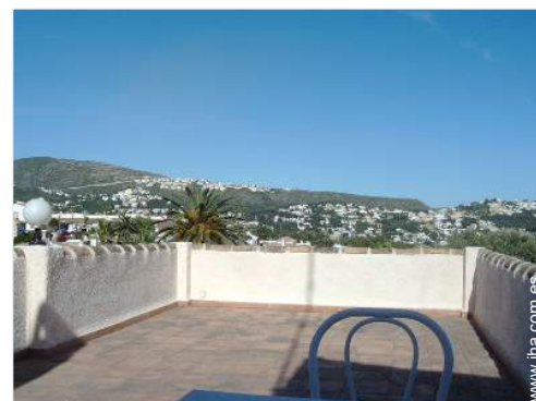
vista sobre las azoteas

Salón de té, barbacoa, mesa(s) de jardín, silla(s) de jardín, sombrilla, área de jardín, 4 reposera(s), ducha exterior, servicio exterior