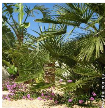
Marco exterior a disposición de los huéspedes