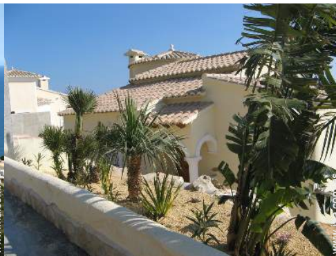
Marco exterior a disposición de los huéspedes