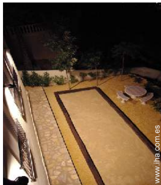
terreno de petanca