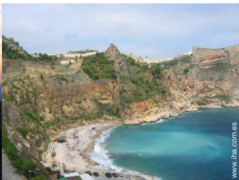
playa de guijarro