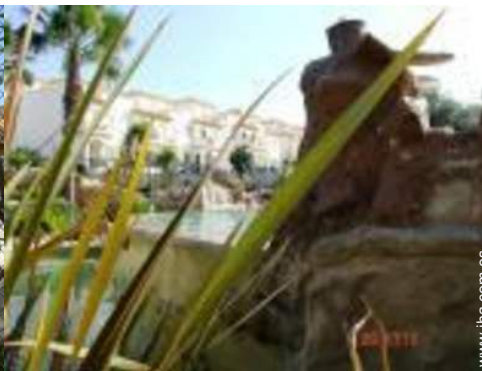
Piscina a desbordamiento