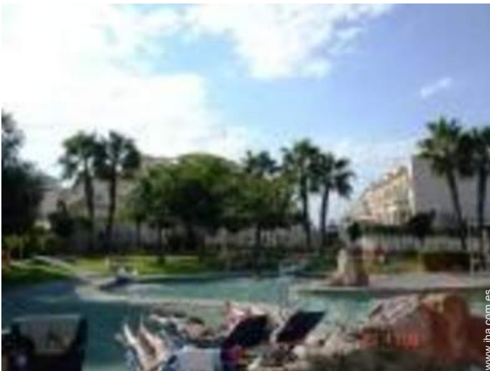
Piscina a desbordamiento