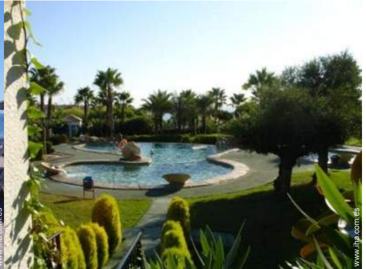
Piscina a desbordamiento