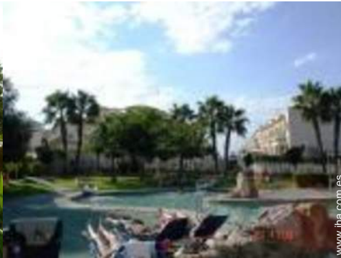
Piscina a desbordamiento