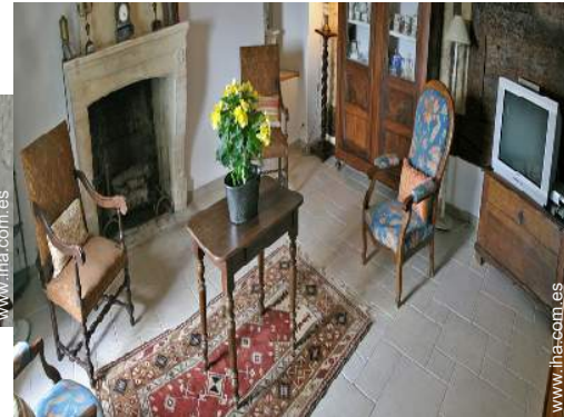
sala de biblioteca