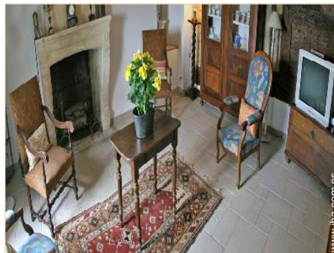
sala de biblioteca