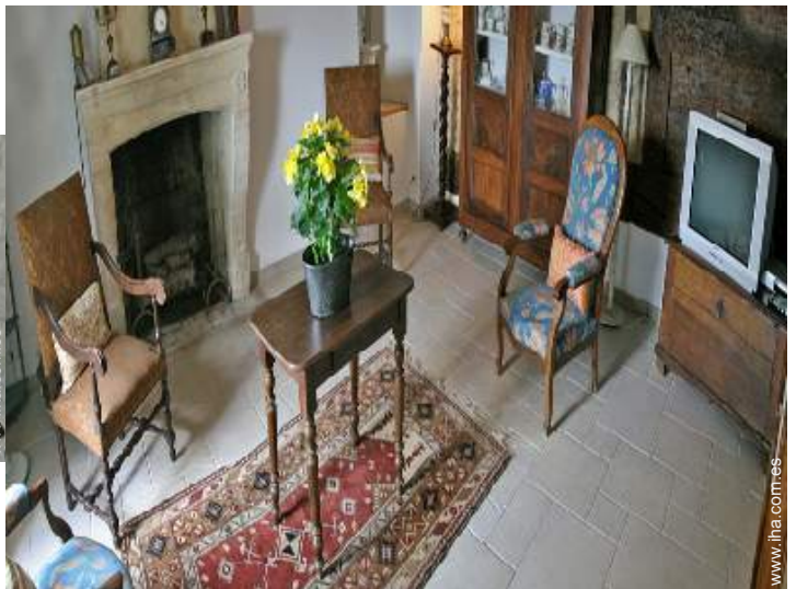
sala de biblioteca